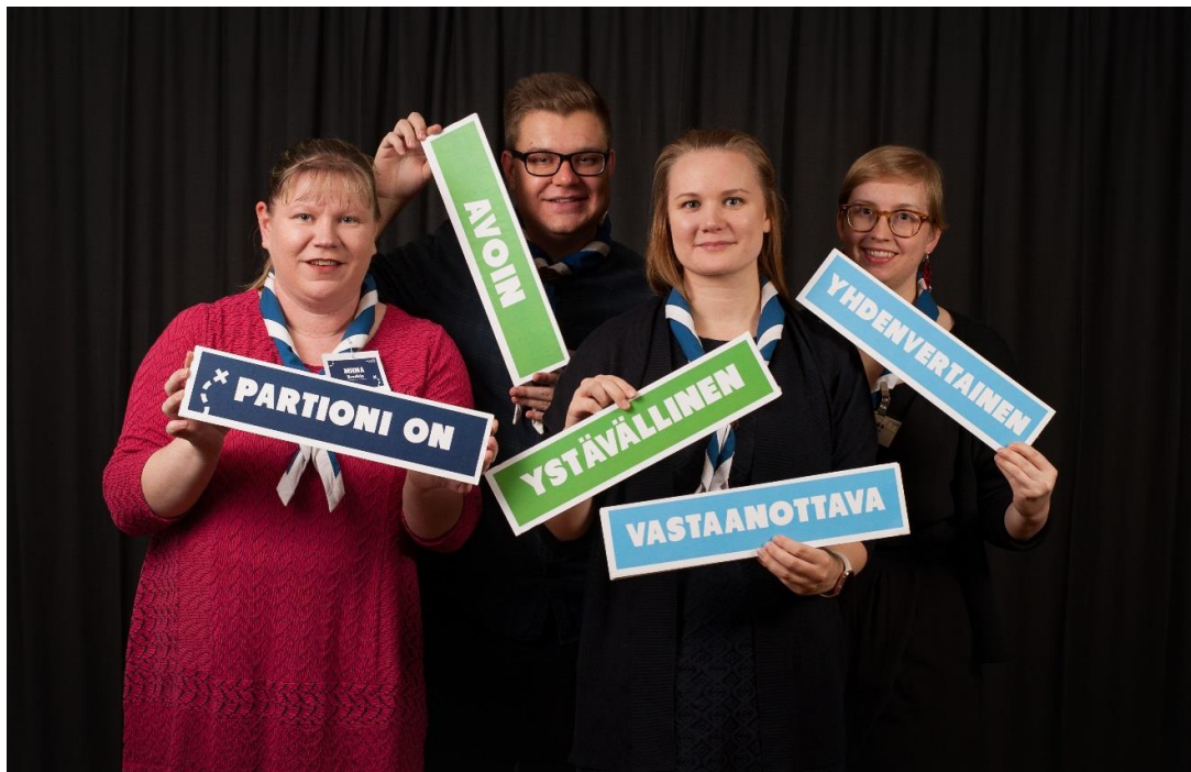
Suomen Partiolaisten moninaisuusryhmän jäseniä Partion Syyspäivillä 2017. Viikonlopun koulutuksia yhdistävä teema oli syrjäytymisen ehkäisy.