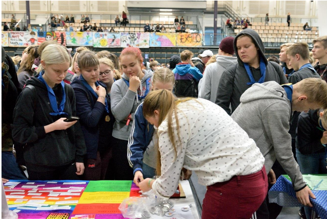
Explo kokosi yhteen 15-17-vuotiaita partiolaisia. Tapahtumassa järjestettiin mm. koulutus väkivallattomasta viestinnästä. Kuvassa seksuaali- ja sukupuolivähemmistöjen Pinkkipartion esittelypiste.