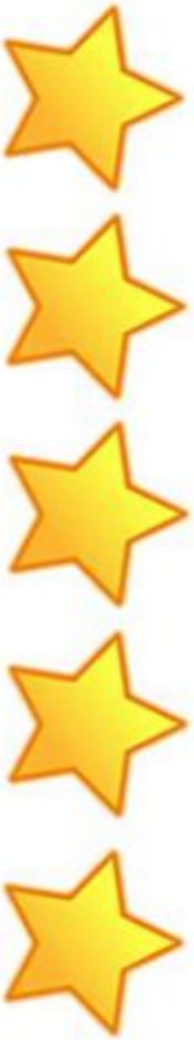
Kuvio 6 Arvio pilouista, viisi tähteä ja kiitettävä.